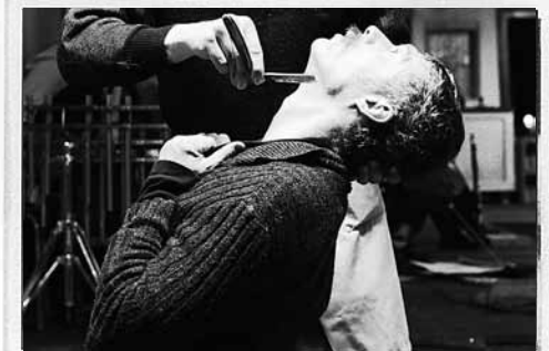
PHÄNOMEN! WOYZECK! ZULAGE!

I like a beautiful song That tells you terrible things. We all like bad news out of a pretty mouth.